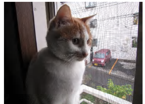
② ‘14.11.25 現在