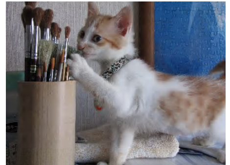
① ‘14.06.27 我が家の家族になった日

猫は間違いなく肉食系である。子供の頃、猛獣、特にライオンや虎が大好きだった私は、肉食動物に対して雑食動物を下等なものとして位置付けていた記憶がある。今思うに、地球上で一番の雑食動物は人間である。最近、フットワークが悪くなったが、私は美味しいものを求めた食べ歩きが大好きであった。だから、食べ物に好き嫌いが無いことを自慢に思っていた。子供の頃の思い込みは訂正しようと思う。